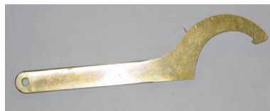
NOR-sleutel messing NOR-key brass