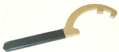
Storz sleutel geïsoleerd 66/81 Storzkey plastic grip 66/81