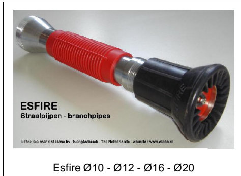
Esfire Ø10 - Ø12 - Ø16 - Ø20