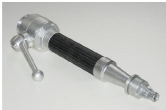
Type LM3P - 2" buitendraad aluminium 2" male thread - material aluminium