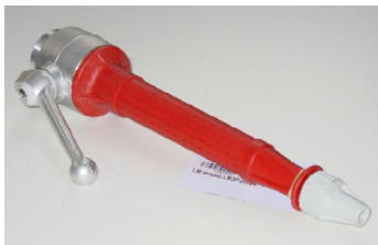
Type LM3P - 2" buitendraad polyprop 2" male thread material polyprop