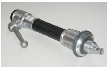
Type LM3P - 2" buitendraad Aluminium met manscherm 2" male thread with water curtain