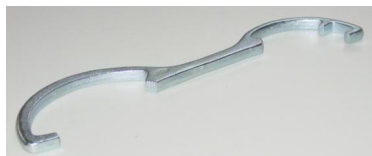
Storz sleutel A-B-C Storz key A-B-C